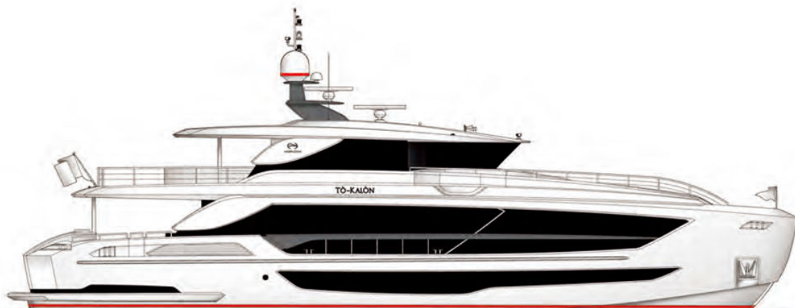
Perfil | Profile