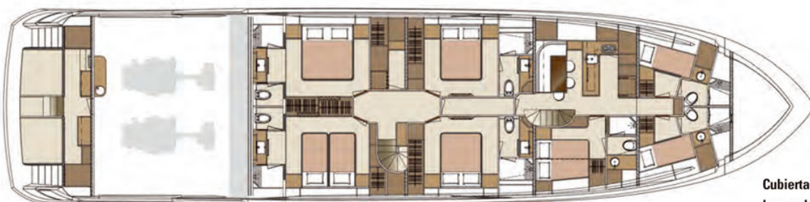
Cubierta inferior Lower deck

Eslora total | LOA 32,75m · Manga | Beam 7,57m · Calado | Draft 1,79m · Motorización | Engine 2 x CAT C32-ACERT 1600HP · Desplazamiento | Displacement 122 BRT · Capacidad combustible | Fuel capacity 17.030 l · Capacidad agua | Water capacity 2.270 l · Diseño interior y exterior | Interior and exterior design Cor D. Rover · Astillero | Shipyard Horizon Yacht